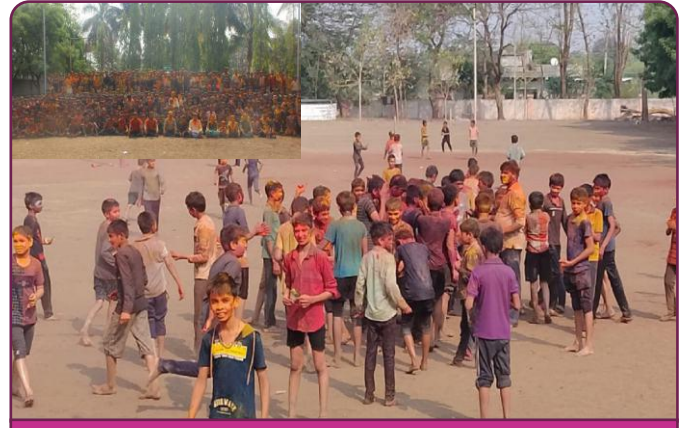
देवगिरी प्रान्त जनकल्याण आवासीय विद्यालय हरंगुल (बु), लातूर में हर्षोल्लास के साथ होली मनायी गयी