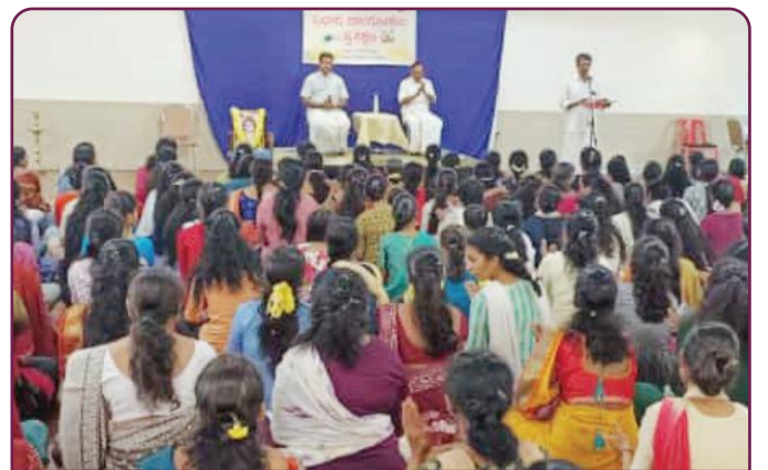
कनटिक दक्षिण प्रान्त में मैंगलोर विभाग द्वारा ग्रीष्मकालीन शिविर प्रशिक्षण वर्ग में प्रतिभागियों की संख्या 248 रही।