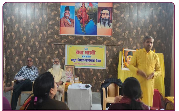
सेवा भारती ब्रज प्रान्त के मथुरा विभाग कार्यकर्ता बैठक आयोजित की गयी ।