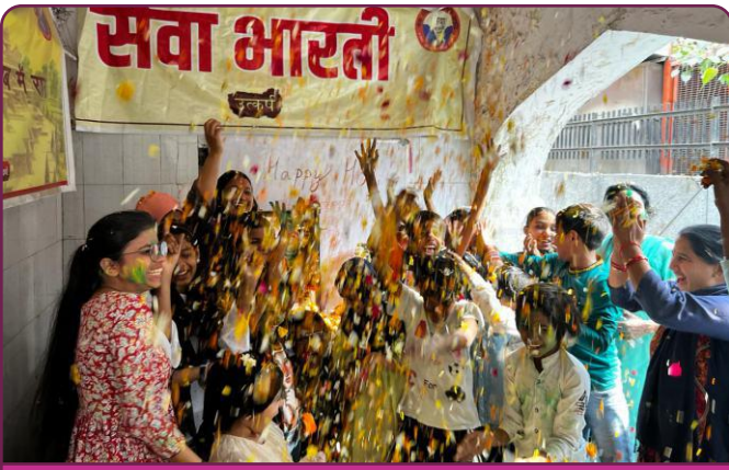
सेवा भारती दिल्ली के उत्कर्ष प्रकल्प पर फूलों की होली का कार्यक्रम आयोजित किया गया ।