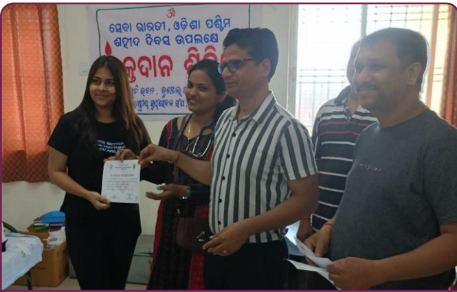
सेवा भारती उड़ीसा पश्चिम में शहीदी दिवस के उपलक्ष पर रक्तदान शिविर आयोजित किया गया ।